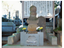
宥勝寺(荘小太郎頼家供養塔)