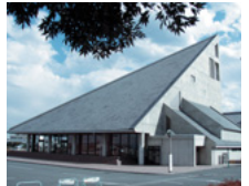
セルティ(児玉総合文化会館)